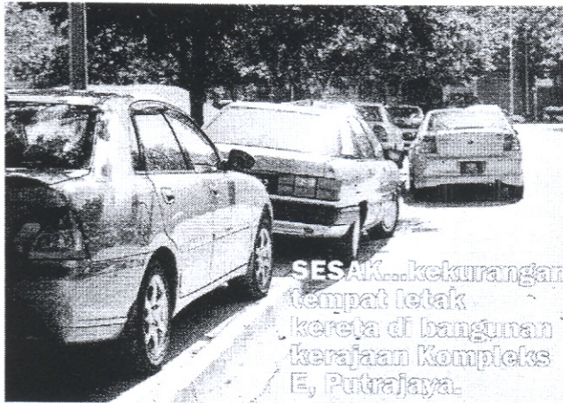
SESAK... kekurangan tempat letak kereta di bangunan kerajaan Kompleks E, Putrajaya.

Tinjauan Metroplus di situ, mendapati jumlah kenderaan terlalu padat sehingga ada terpaksa diletakkan di tepi jalan sehingga menghalang laluan