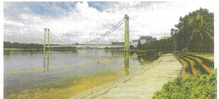
PANTAI Floria menjadi tarikan bagi peminat aktiviti pesisir pantai.

Destinasi menarik di kawasan pusat pentadbiran kerajaan Persekutuan suntik 'mood' percutian