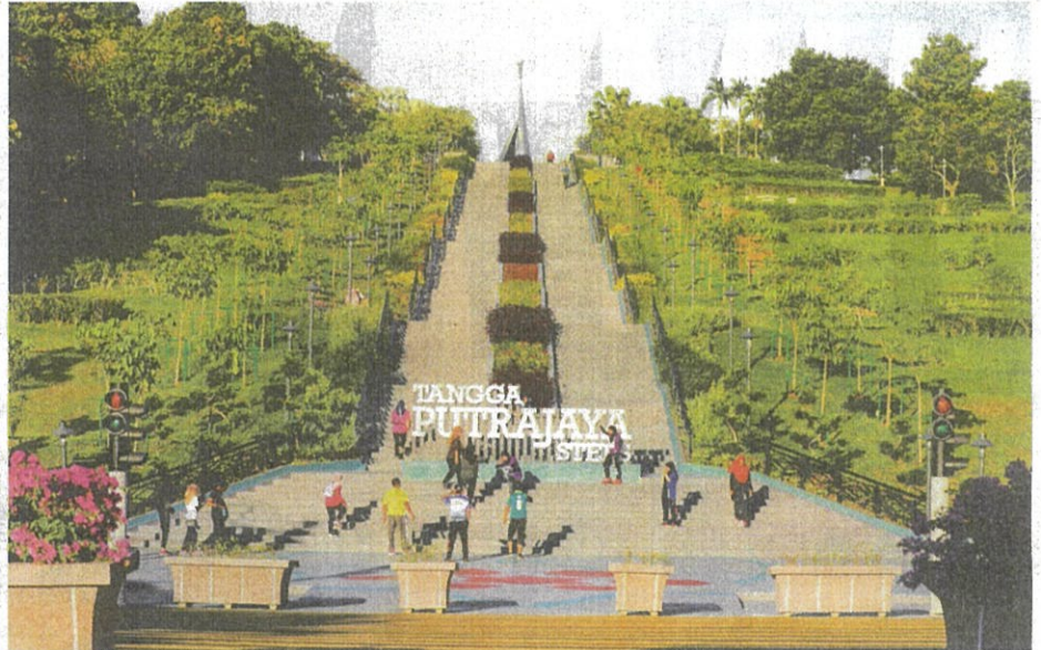
TANGGA Putrajaya boleh jadi lokasi latihan pendakian baharu.

terbaharu Putrajaya yang turut dinobatkan sebagai Tangga Terpanjang Di Taman Awam oleh Malaysia Book Of Record (MBOR) pada 20 Januari lalu.