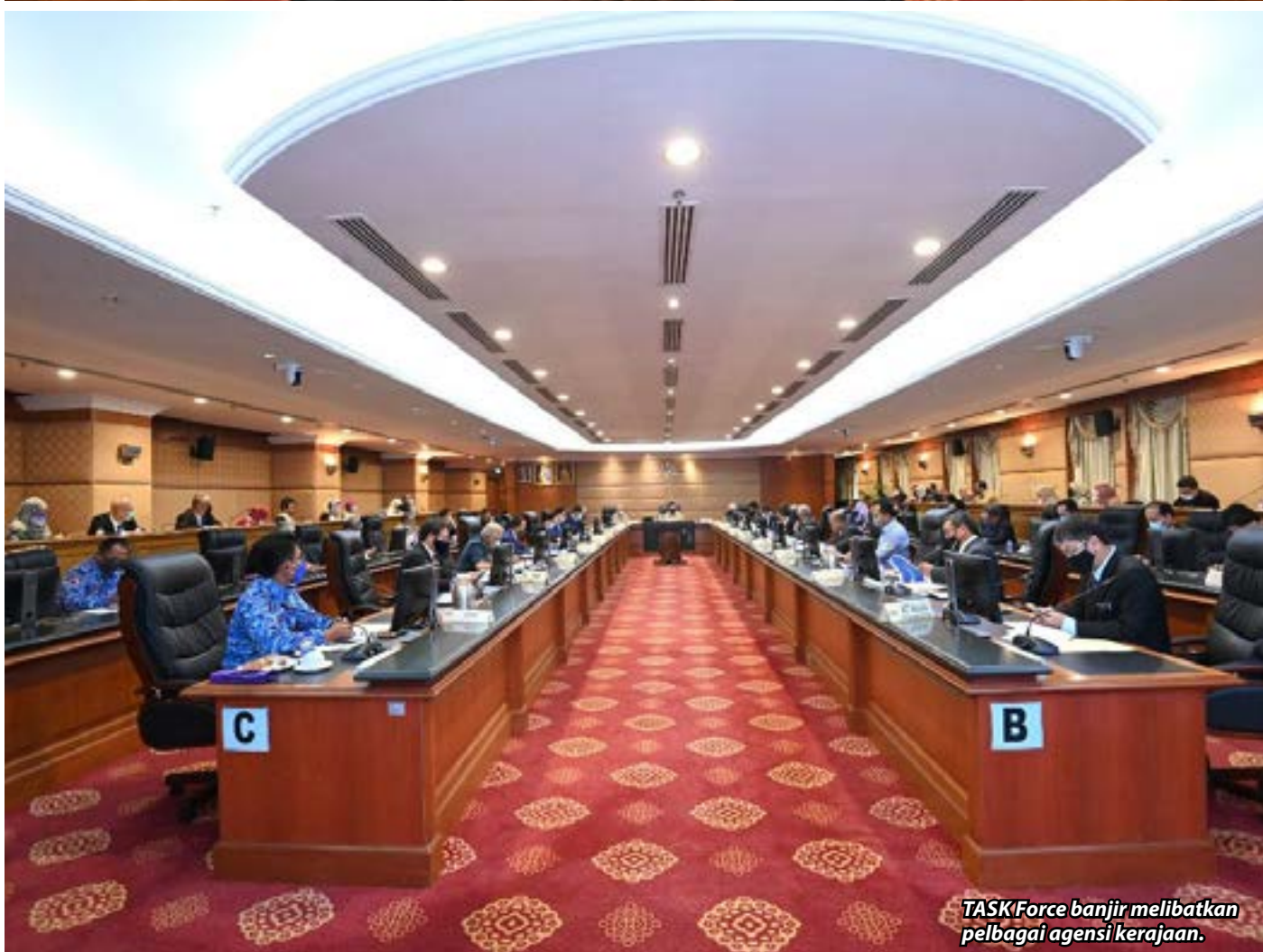
TASK Force banjir melibatkan pelbagai agensi kerajaan.