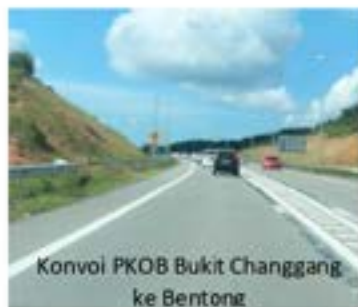
Konvoi PKOB Bukit Changgang ke Bentong

PKOB Bukit Changgang mengucapkan ribuan terima kasih diatas kerjasama yang telah diberikan oleh semua pihak yang terlibat terutamanya secara langsung atau tidak dalam menjayakan Misi Bantuan Banjir KWP di Bukit Changgang.