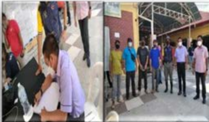
Kunjungan daripada Peg. Daerah Bentong dan program agihan bakul makanan

Hari ini juga, PKOB Bentong turut menerima kunjungan daripada Pegawai Daerah Bentong yang melahirkan penghargaan kepada KWP dan agensi atas bantuan yang dihulurkan bagi kelangsungan dan kelestarian daerah ini.