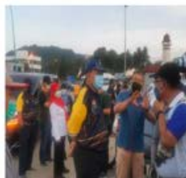
Tinjauan YBM ke PKOB Bentong

PKOB Bentong untuk meninjau persiapan dan perancangan operasi PKOB Bentong yang akan bermula pada 27 Disember 2021. 8 kawasan telah dikenalpasti sebagai Kawasan sasaran operasi PKOB Bentong melibatkan kerja-kerja pembersihan, pembuangan sampah dan agihan bakul makanan.