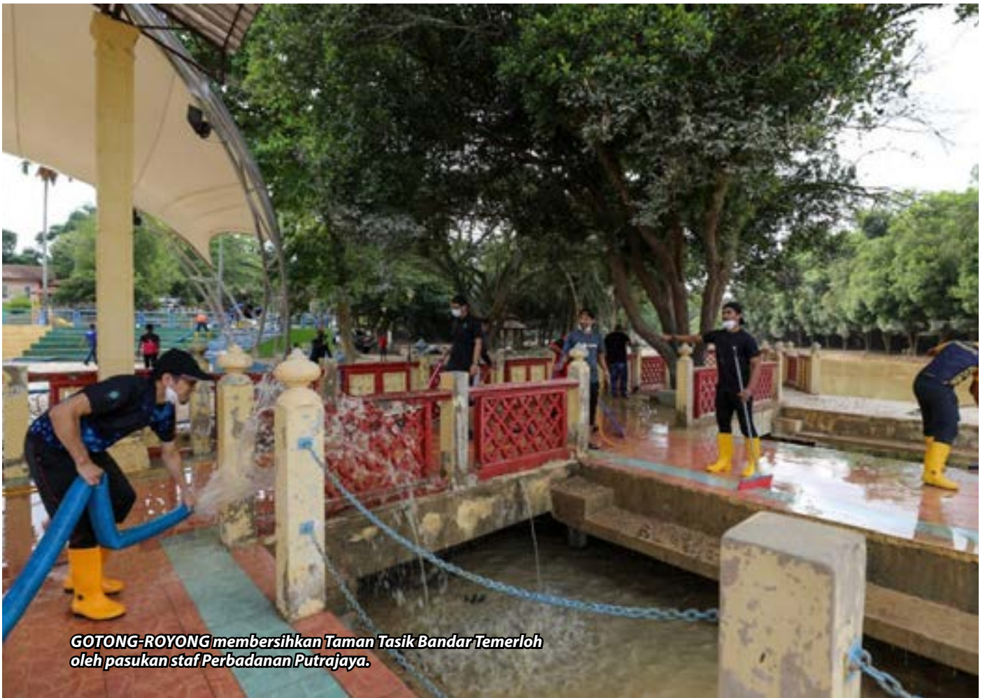
GOTONG-ROYONG membersihkan Taman Tasik Bandar Temerloh oleh pasukan staf Perbadanan Putrajaya.