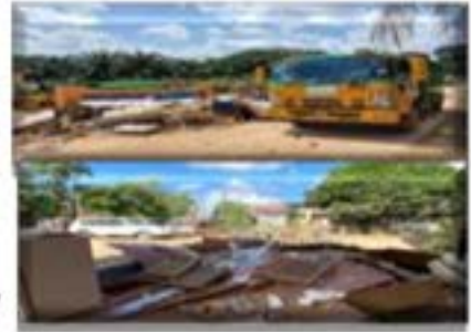
Kerja-kerja pembersihan di Klinik Kesihatan Sungai 2.

Operasi PKOB Bentong pada hari ini telah bergerak secara aktif dengan penglibatan petugas / sukarelawan daripada KWP, Pejabat Tanah & Galian W.P Kuala Lumpur dan Putrajaya, DBKL, PPj serta Yayasan Wilayah Persekutuan (PRIVO & Anjung Kelana) yang berjumlah 189 orang. Secara keseluruhannya, operasi pada hari ini telah berjaya membersihkan empat (4) kawasan sasaran iaitu Masjid Karak Setia, Klinik Kesihatan Sungai 2, Dewan Orang Ramai Kg. Benus. Operasi hari ini juga telah dijayakan bersama Task Force majlis Perbandaran Bentong yang bertempat