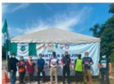
PKOB Bukit Changgang Tamat

PKOB Bukit Changgang telah menjalankan Misi Bantuan Banjir KWP di Bukit Changgang, Daerah Kuala Langat telah menghulurkan bantuan banjir semalam 6 hari bermula 22 Disember 2021. Sebanyak 12 kemudahan awam telah dibersihkan dan dipulih, air telah disurutkan melalui pengepaman air ke sungai langat, 200 bakul makanan telah diedarkan dan sampah-sampah juga telah berjaya dikurang.