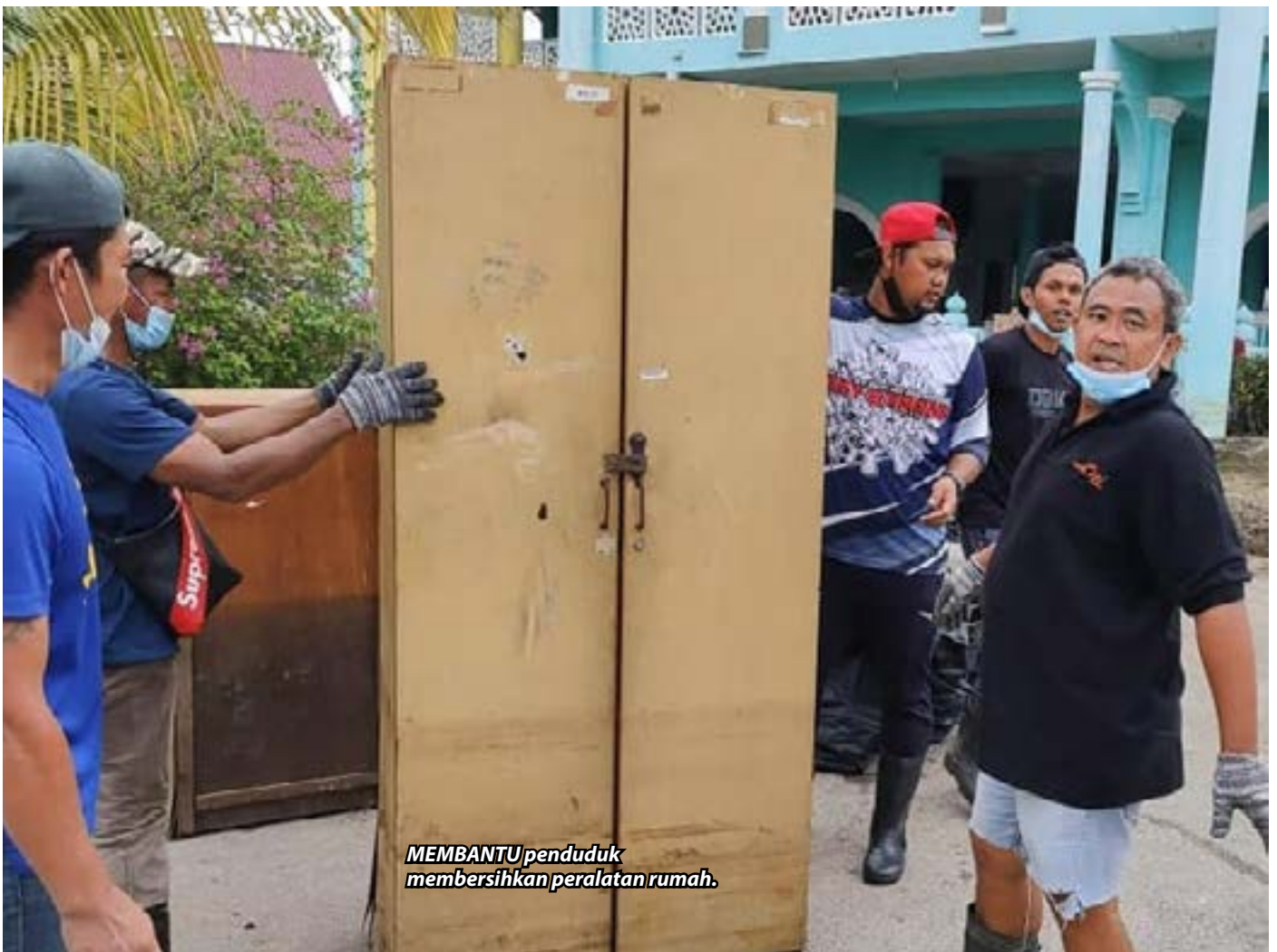
MEMBANTU penduduk membersihkan peralatan rumah.