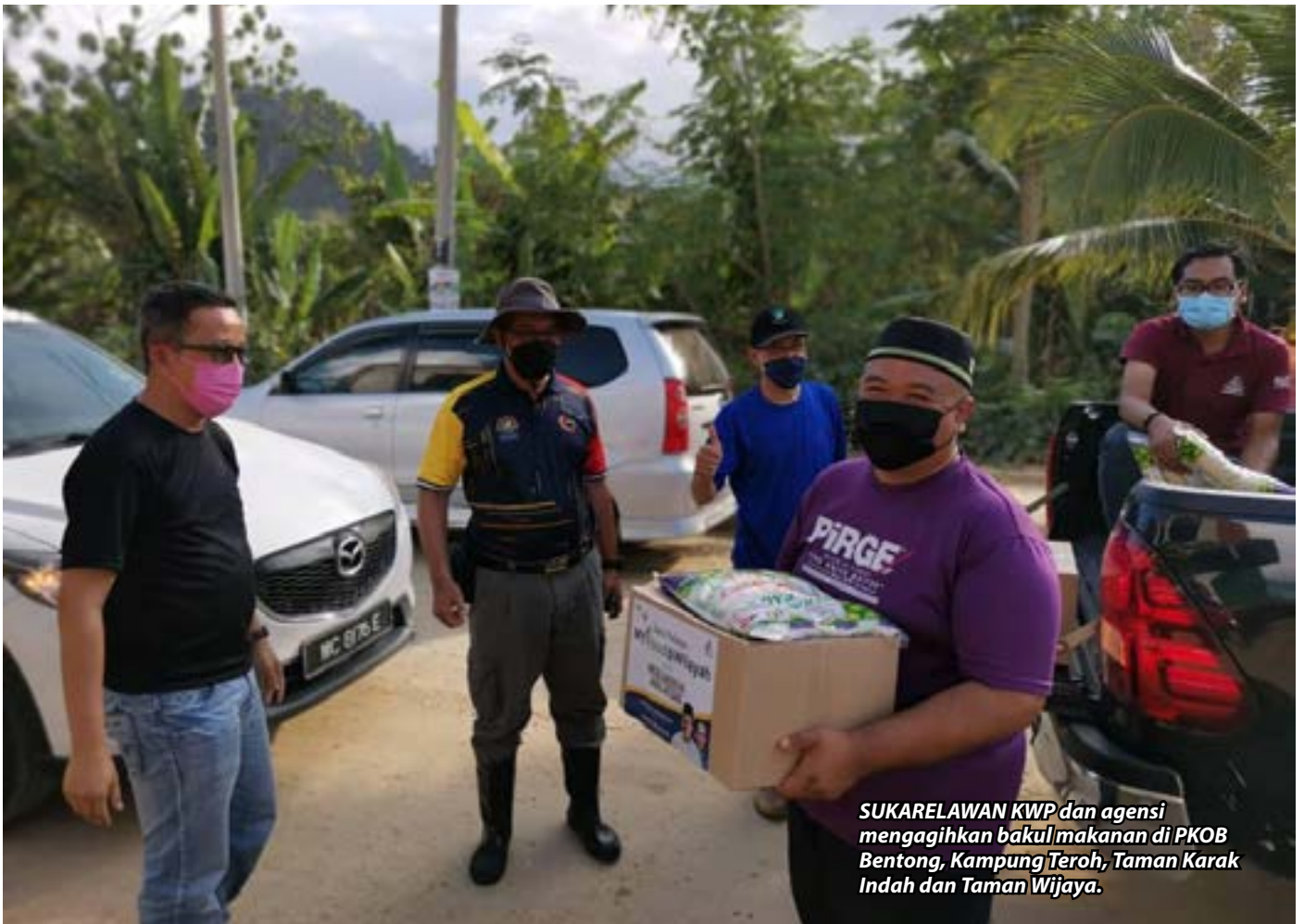
SUKARELAWAN KWP dan agensi mengagihkan bakul makanan di PKOB Bentong, Kampung Teroh, Taman Karak Indah dan Taman Wijaya.