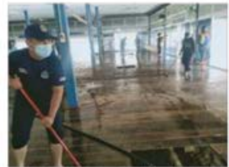
Kerja-kerja pembersihan di Masjid Karak Setia