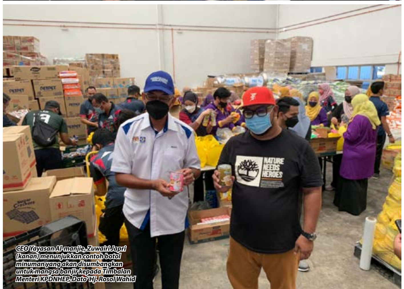
GEO Yayasan Al-manjie, Zuwairi Japri (kanan) menunjukkan contoh botol minuman yang akan disumbangkan untuk mangsa banjir kepada Menteri KPDNHEP, Dato' Hj. Rosol Wahid