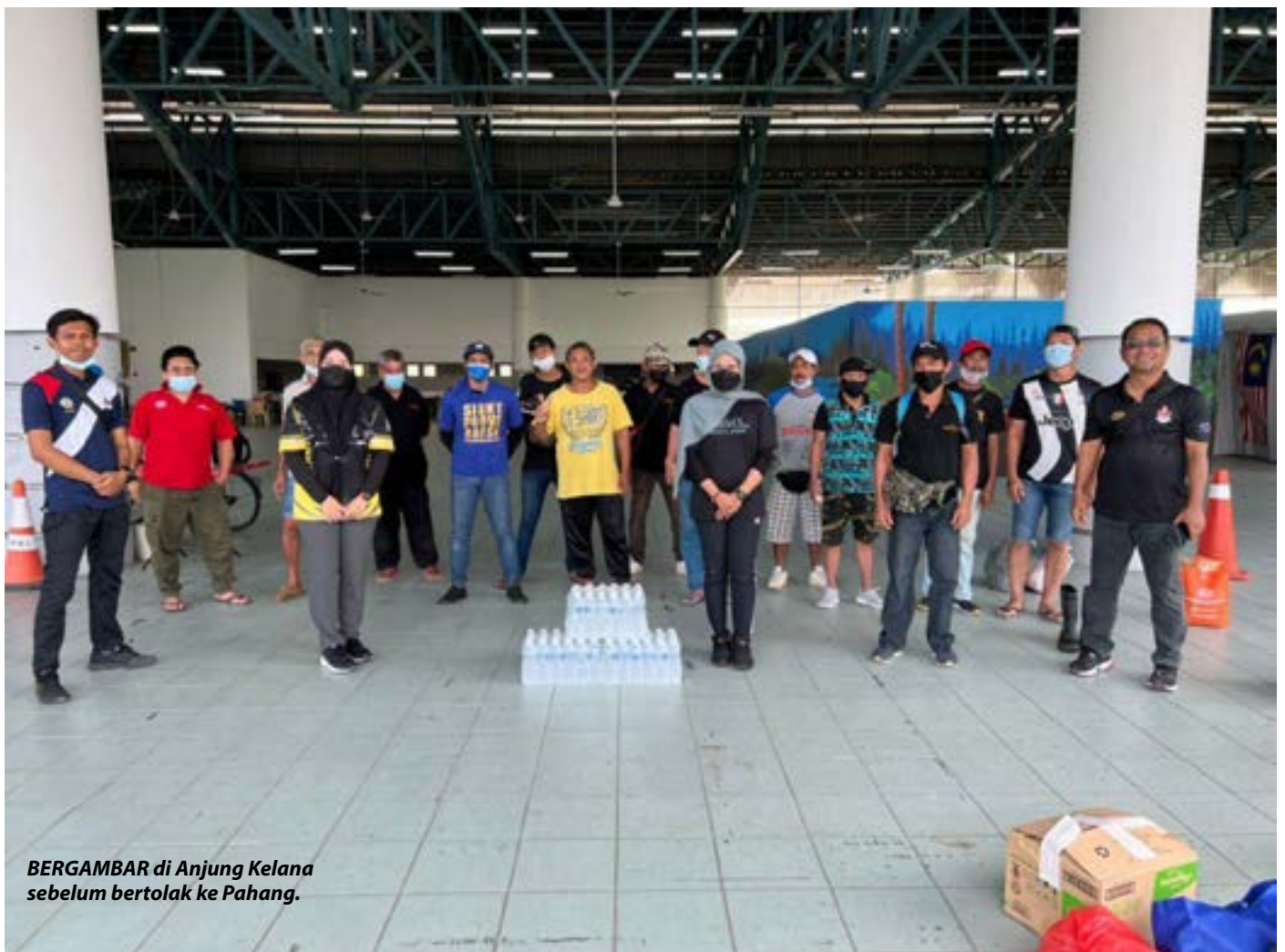
BERGAMBAR di Anjung Kelana sebelum bertolak ke Pahang.