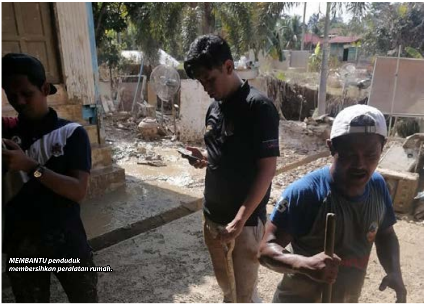
MEMBANTU penduduk membersihkan peralatan rumah.